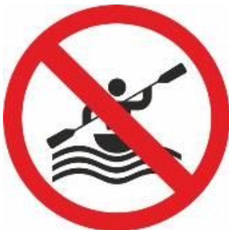
Rys.90 Zakaz pływania