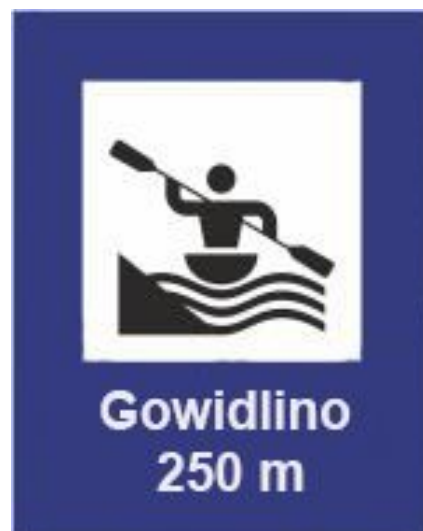
Rys. 80 Miejsce przystankowe, lewy brzeg szlaku