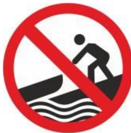
Rys.91 Zakaz wodowania