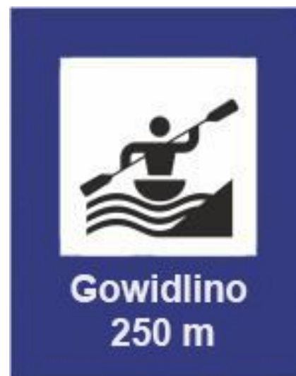
Rys. 81 Miejsce przystankowe, prawy brzeg szlaku.