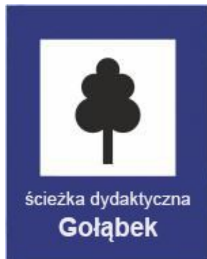
Rys.84 Atrakcja turystyczna