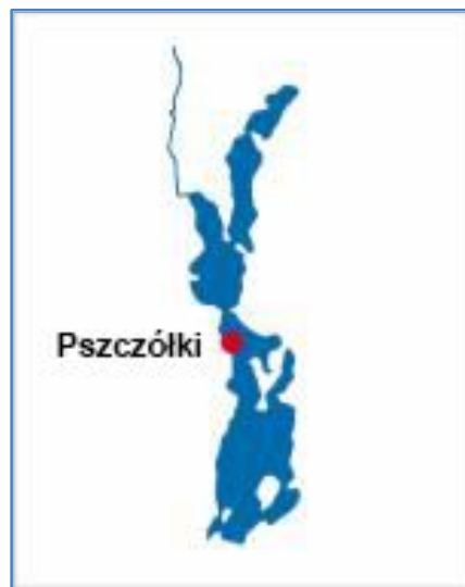
Rys. 93 Schemat jeziora z zaznaczonym miejscem przebywania