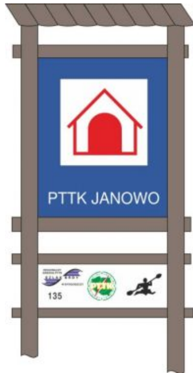
Rys. 95 Tablica informacyjna z zadaszaniem