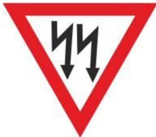
Rys.88 Elektrownia wodna + nazwa miejscowości/elektrowni