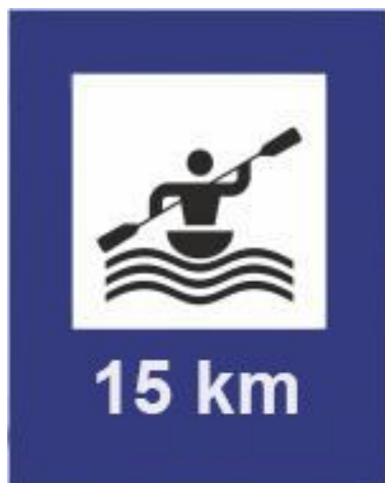
Rys. 79 Znak szlaku z kilometrażem liczonym w górę rzeki