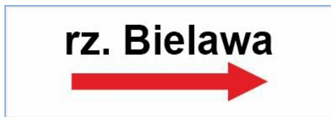
Rys.94 Kierunek szlaku kajakowego