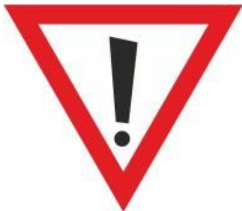
Rys. 87 Miejsce niebezpieczne (zachować szczególną ostrożność)