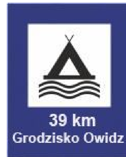
Rys. 82 Pole biwakowe