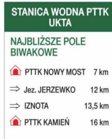
Rys. 96 Tablica informacyjna płaska