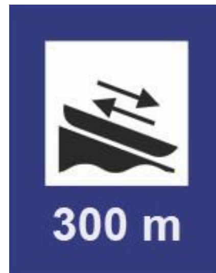
Rys.86 Miejsce wodowania/ /przenoska/przewózka kajaków – lewy brzeg szlaku