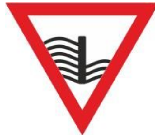
Rys.89 Jaz/zapora/inna duża budowla hydrotechniczna