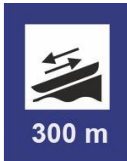
Rys.85 Miejsce wodowania/ /przenoska/przewózka kajaków – prawy brzeg szlaku