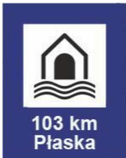
Rys.83 Stanica wodna